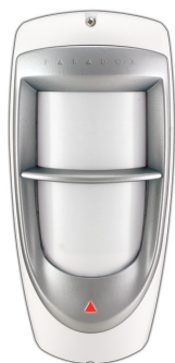
Figure / Figura 1